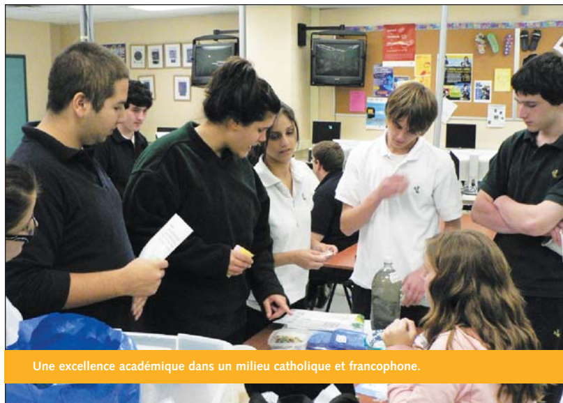
Une excellence académique dans un milieu catholique et francophone.

Pour aider l'élève dans son cheminement professionnel et scolaire, nous lui proposons des exemples de professions axées sur différents