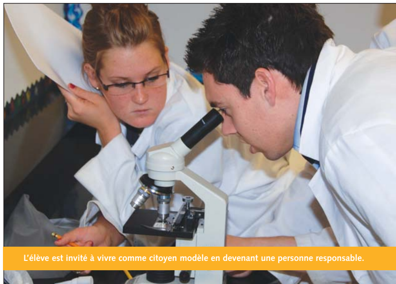
L'élève est invité à vivre comme citoyen modèle en devenant une personne responsable.