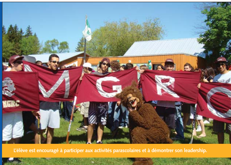
L'élève est encouragé à participer aux activités parascolaires et à démontrer son leadership.