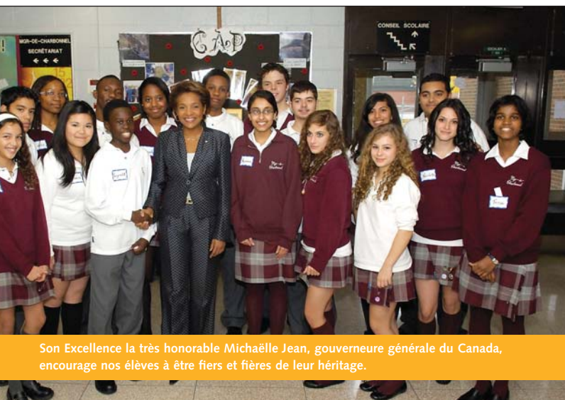
Son Excellence la très honorable Michaëlle Jean, gouverneure générale du Canada, encourage nos élèves à être fiers et fières de leur héritage.

Il me fait grand plaisir de vous accueillir à l'école secondaire catholique Mgr-de-Charbonnel et de vous offrir dans ce Prospectus la gamme de cours que nous offrons pour préparer nos élèves pour l'université, le collège ainsi que le monde du travail.