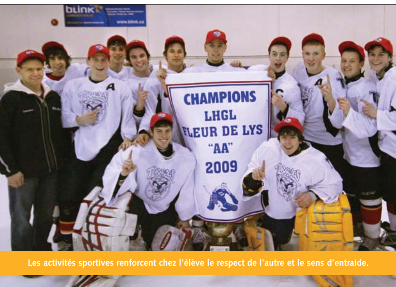
Les activités sportives renforcent chez l'élève le respect de l'autre et le sens d'entraide.