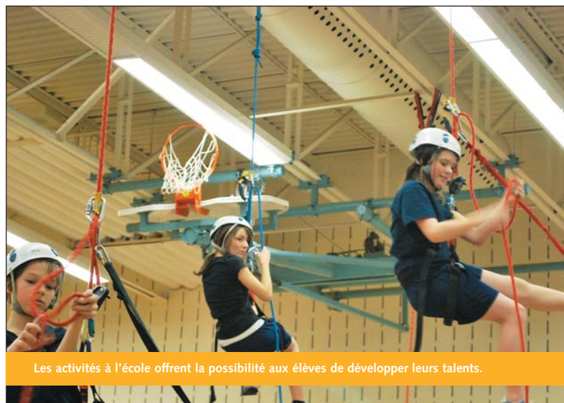
Les activités à l'école offrent la possibilité aux élèves de développer leurs talents.