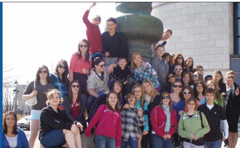
Les activités artistiques assurent le plein développement de l'élève.

450, chemin Maple Grove Cambridge ON N3H 4R7 ☎ 519.650.9444 • 📠 519.650.9313 SANS FRAIS 1 866 253.6375 http://prdg.csdccs.edu.on.ca