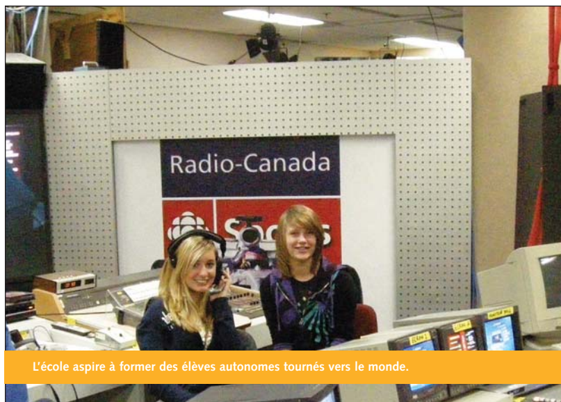
L'école aspire à former des élèves autonomes tournés vers le monde.

Ce profil cible des aptitudes qui contribueront au plein développement de l'élève. Nous espérons améliorer la conscience sociale et la culture personnelle du jeune pour mieux le préparer aux défis de demain. Les valeurs et les attitudes touchent toutes les dimensions scolaires tant physiques, sociales et affectives qui sous-tendent la mission de l'école catholique franco-ontarienne ainsi que la mission du Baccalauréat international.