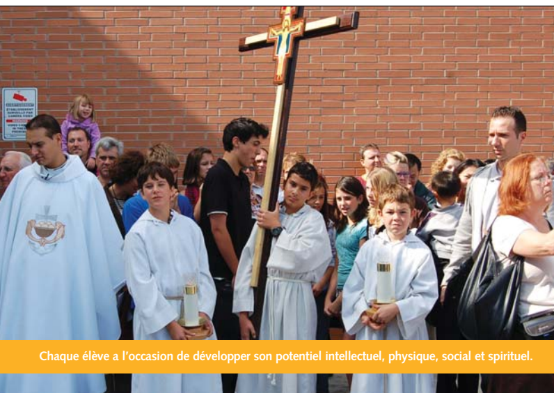
Chaque élève a l'occasion de développer son potentiel intellectuel, physique, social et spirituel.

L'école secondaire catholique Renaissance a su innover depuis son ouverture et elle continue de le faire. Elle garde précieusement son approche centrée sur les élèves et leurs besoins. Favorisant la transmission des valeurs chrétiennes de notre communauté, l'école secondaire catholique Renaissance désire poursuivre sa marche qui aboutira, en février 2007, à l'ouverture de notre nouvel édifice.