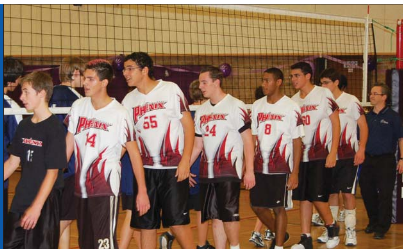
Les élèves sont bien outillés pour faire face aux défis du postsecondaire et du marché du travail.