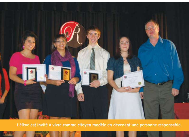
L'élève est invité à vivre comme citoyen modèle en devenant une personne responsable.