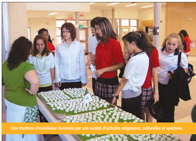
Une tradition d'excellence favorisée par une variété d'activités religieuses, culturelles et sportives.