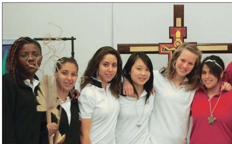
Les activités culturelles permettent à l'élève de s'épanouir.