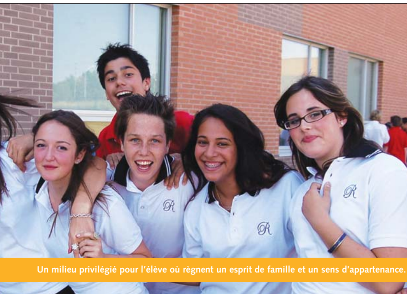
Un milieu privilégié pour l'élève où règnent un esprit de famille et un sens d'appartenance.