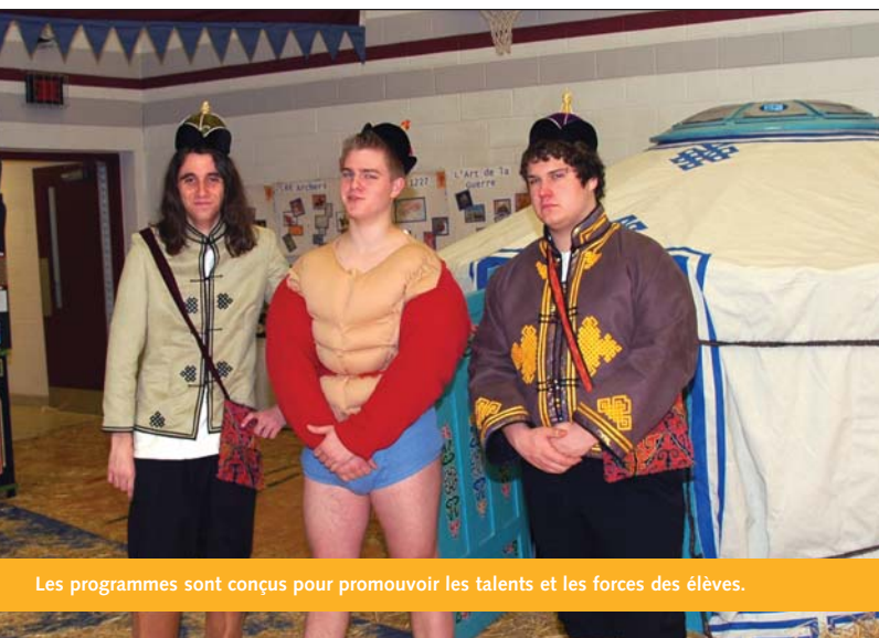
Les programmes sont conçus pour promouvoir les talents et les forces des élèves.