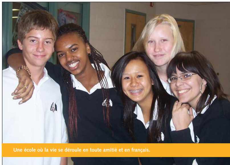
Une école où la vie se déroule en toute amitié et en français.

Fondée en 1989, l'ÉSCSF s'est dotée d'un logo se basant sur le principe que l'école est un milieu d'éducation qui est le prolongement de la famille. Les parents sont nos partenaires et notre mission nous demande d'agir en tant que tuteurs auprès de ces jeunes pour assurer leur éducation et leur épanouissement dans un milieu enrichi de valeurs morales et religieuses. S'inspirant par l'amour de la Sainte Famille, le personnel de l'école peut donc miser sur la fierté de notre foi, de notre langue et de notre culture au sein d'une société multiculturelle.