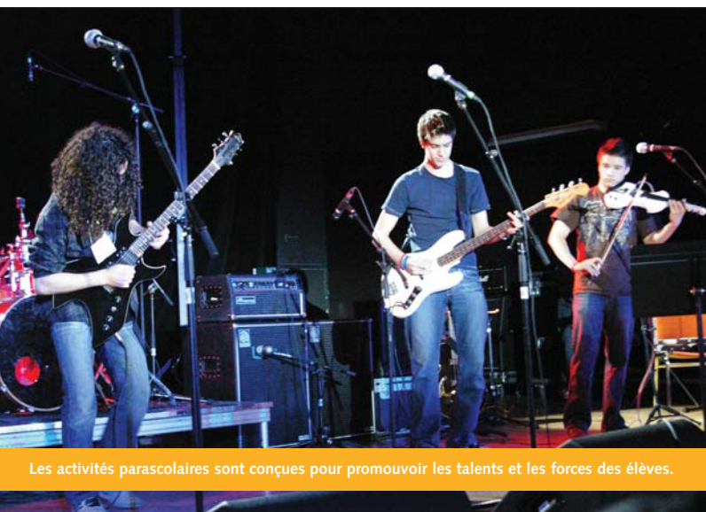
Les activités parascolaires sont conçues pour promouvoir les talents et les forces des élèves.

Nous offrons le service de l'enfance en difficulté en format « module » pour les élèves nécessitant