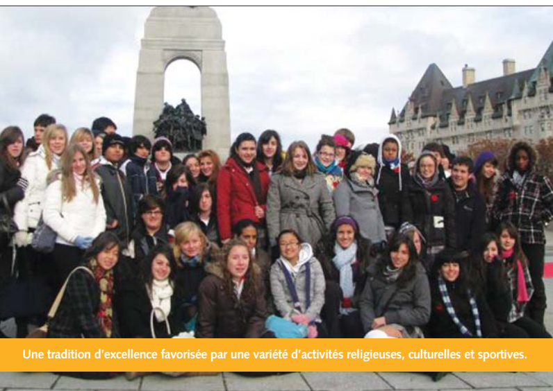
Une tradition d'excellence favorisée par une variété d'activités religieuses, culturelles et sportives.

C'est avec beaucoup d'enthousiasme que je vous accueille à notre école qui offre des cours de la 7 e à la 12 e année. En parcourant ce prospectus, vous découvrirez une programmation détaillée et spécialisée menée à bien par un personnel exceptionnel, compétent et dévoué qui saura vous guider sur la voie du succès pendant vos quatre années du secondaire chez nous. Vous serez fiers d'être un Cougar!